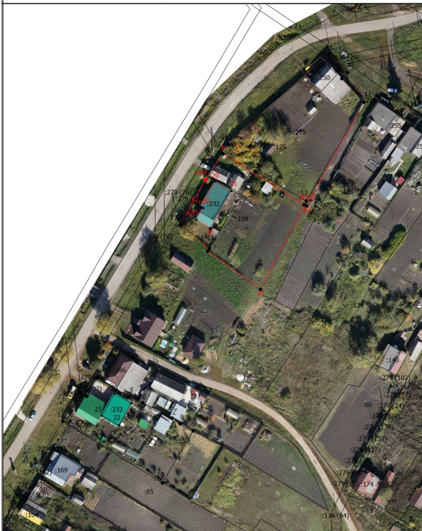
Схема границ земельных участков